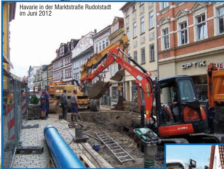
Havarie in der Marktstraße Rudolstadt im Juni 2012