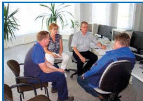
Kläranlage Saalfeld – Konzentrierte Gesprächsrunden führen zur Optimierung gegenwärtiger Zielstellungen.