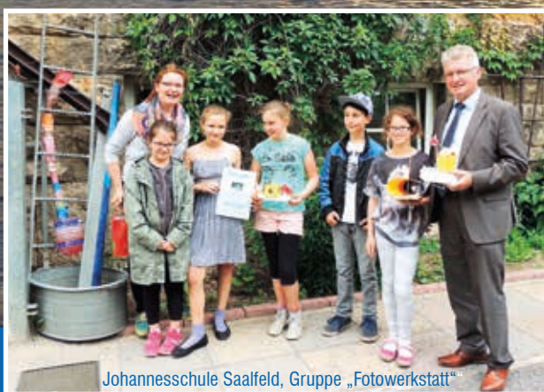
Johannesschule Saalfeld, Gruppe „Fotowerkstatt“