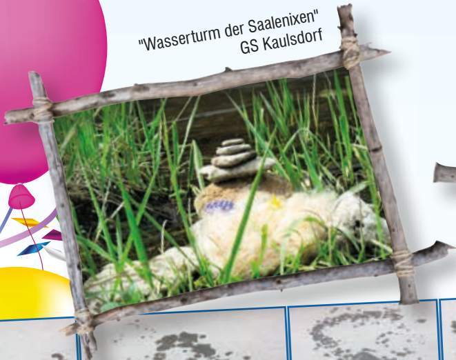
"Wasserturm der Saalenixen" GS Kaulsdorf