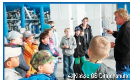
4. Klasse GS Dittrichshütte