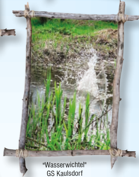
"Wasserwichtel" GS Kaulsdorf