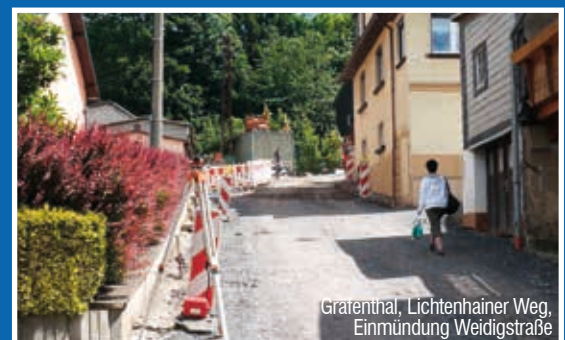
Gräfenthal, Lichtenhainer Weg, Einmündung Weidigstraße

Die Maßnahme wurde bereits im Jahr 2015 begonnen. Der Bauanfang in der Oberen Coburger Straße war Anfang Oktober 2015. Der untere Abschnitt des Lichtenhainer Weges , bis zur Einmündung der Weidigstraße wurde bereits vergangenes Jahr fertiggestellt. Im Jahr 2016 wird der obere Bereich bis zum Haus Nr. 19 ebenfalls grundhaft saniert. Parallel und gemeinsam mit dem ZWA Saalfeld-Rudolstadt, verlegen die Thüringer Energienetze GmbH sowie die Fa. Elektro-Höfer ihre jeweiligen Medienleitungen. Die Fertigstellung der Maßnahme ist für Ende September 2016 vorgesehen. Die Leistungen des ZWA Saalfeld-Rudolstadt beinhalten einen Leistungsumfang von ca. 400.000 Euro, wobei hiervon der Abwasserbereich einen Kostenanteil von ca. 260.000 Euro einnimmt.