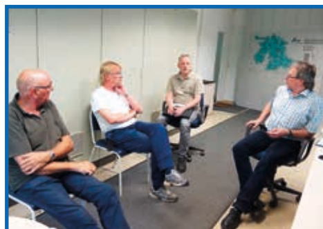
Wasserwerk Wöhlsdorf – Erläuterung vorgenommener Optimierungen durch Pumpenaustausch mit Schwerpunkt Energieeffizienz.