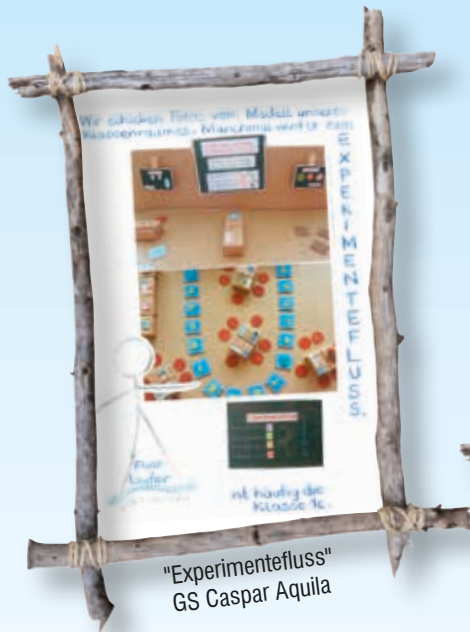
"Experimentfluss" GS Caspar Aquila