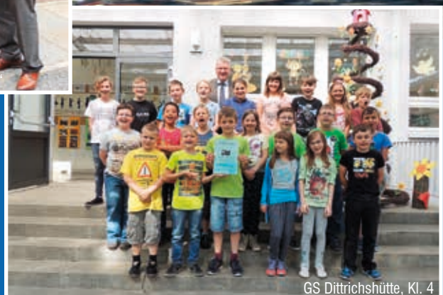
GS Dittrichshütte, Kl. 4

Wir bedanken uns an dieser Stelle nochmals ganz herzlich bei allen Fotografen für die Zusendung der zahlreichen großartigen Fotos.