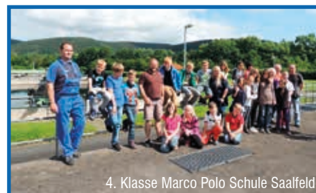
4. Klasse Marco Polo Schule Saalfeld

Wasser ist unser wichtigstes Lebensmittel! – Unter diesem Motto unternahmen die Viertklässler der Grundschule Dittrichshütte am 19.05.2016 einen Ausflug in das Wasserwerk Wöhlsdorf.