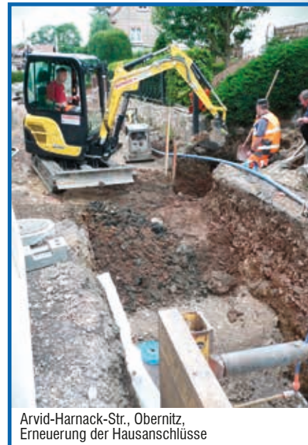
Arvid-Harnack-Str., Obernitz, Erneuerung der Hausanschlüsse

Wegen der sehr beengten Verhältnisse sind natürlich auch die Beeinträchtigungen für die Anwohner recht beträchtlich. Wir bitten bei allen Beteiligten hierfür um Verständnis. Für die bisherige gute Zusammenarbeit mit den unmittelbar betroffenen Grundstückseigentümern möchten wir uns auf diesem Wege bedanken.