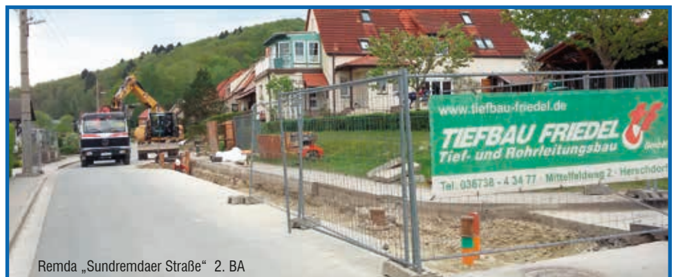
Remda „Sundremdaer Straße“ 2. BA

Bis Ende Juni 2016 erfolgte die Fortführung der Kanalnetzerneuerung in der Sundremdaer Straße als 2. Bauabschnitt, vom Kreuzungsbereich Zur Schlagmühle bis zum Ortsausgang in Richtung Sundremda. Somit wurde die abwassertechnische Anbindung der restlichen Anliegergrundstücke der Sundremdaer Straße an die Kläranlage Remda umgesetzt.