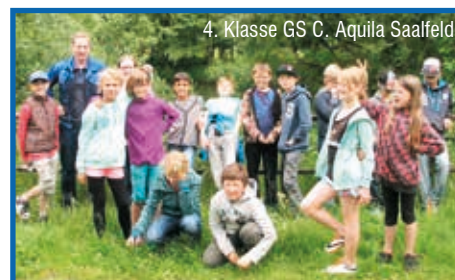
4. Klasse GS C. Aquila Saalfeld