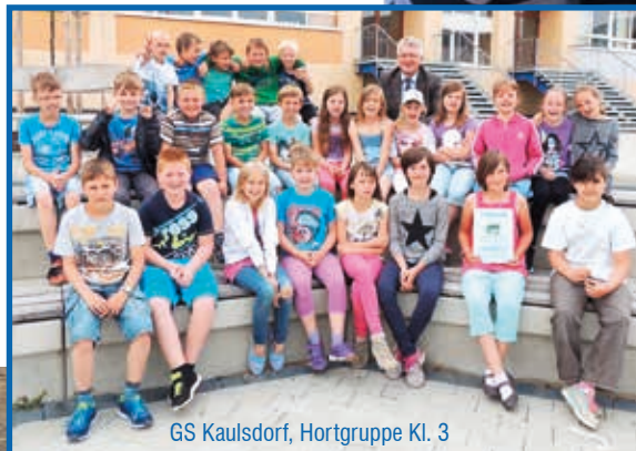
GS Kaulsdorf, Hortgruppe Kl. 3