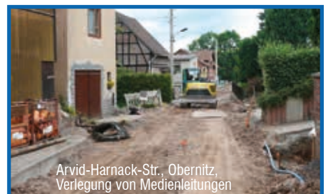
Arvid-Harnack-Str., Obernitz, Verlegung von Medienleitungen

Seit Mitte April 2016 wird die komplexe Gemeinschaftsmaßnahme in Saalfeld, OT Obernitz, durchgeführt. Es handelt sich um eine Gemeinschaftsmaßnahme des ZWA Saalfeld-Rudolstadt mit der Stadt Saalfeld, der Saalfelder Energienetze GmbH und der Deutschen Telekom. Ziel der Maßnahme des Zweckverbandes ist der abwasserseitige Anschluss der Arvid-Harnack-Straße an die zentrale Kläranlage Saalfeld. Durch diesen Anschluss wird eine umweltschutztechnische Auflage des