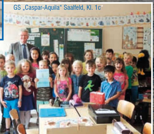
GS „Caspar-Aquila“ Saalfeld, Kl. 1c