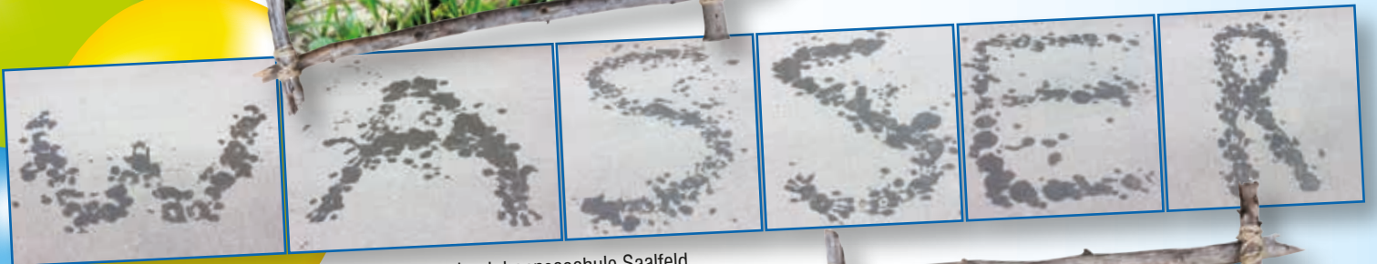
Fotocollage der Johanneschule Saalfeld