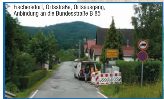
Fischersdorf, Ortsstraße, Ortsausgang, Anbindung an die Bundesstraße B 85

Die Fertigstellung der gesamten Baumaßnahme ist für Ende November 2017 eingeplant. Die Arbeiten werden abschnittsweise unter jeweiliger Vollsperrung der Straße erfolgen. Während der witterungsbedingten Winterpause ist der örtliche Verkehr allerdings freigegeben. Der ZWA Saalfeld-Rudolstadt wird innerhalb der Bauzeit von zwei Jahren in der Ortsstraße von Fischersdorf ca. 800 m neue Trinkwasserleitung sowie ca. 1.500 m Schmutz- und Regenwasserkanäle verlegen. Der Zweckverband investiert insgesamt ca. 750.000 Euro, wobei hiervon auf den Abwasserbereich ca. 550.000 Euro entfallen. Die Gesamtmaßnahme wird voraussichtlich einen Kostenrahmen von ca. 1.600.000 Euro umfassen.