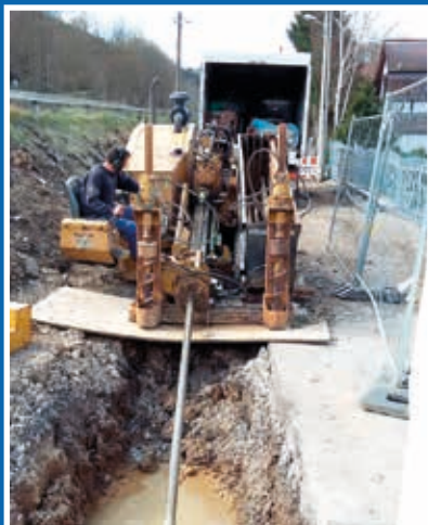
Maschine zur Durchführung der Pilotbohrung

Diese Verlegetechnik ist ein sehr schonendes Verfahren, das nur punktuelle Eingriffe in den Oberflächen und im Erdreich erfordert.